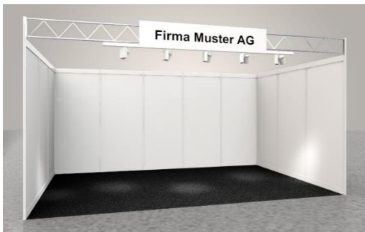
Beispiel Reihenstand 15m 2